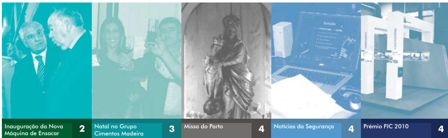
Inauguração da Nova Máquina de Ensacar